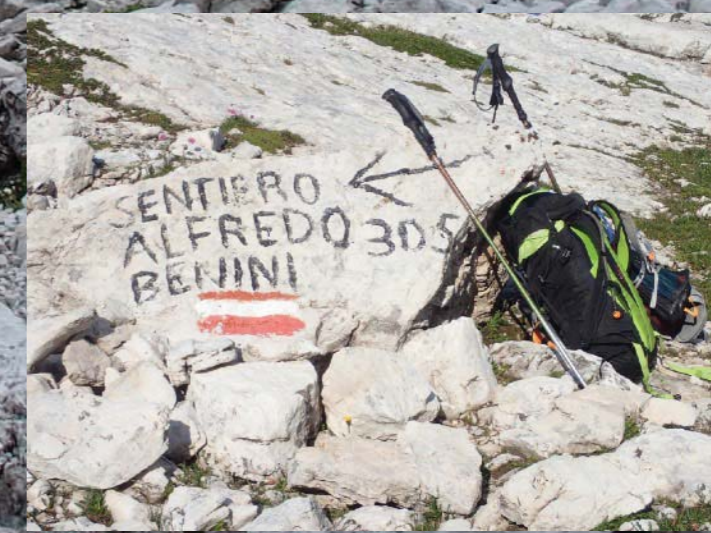
Après un long voyage, nous voici enfin dans les Dolomites, et plus précisément dans la Brenta. Ce beau massif calcaire est célèbre pour ses magnifiques falaises verticales dominant les vallées. Les montagnes regorgent de sentiers, à la limite entre randonnées du vertige et via ferrata