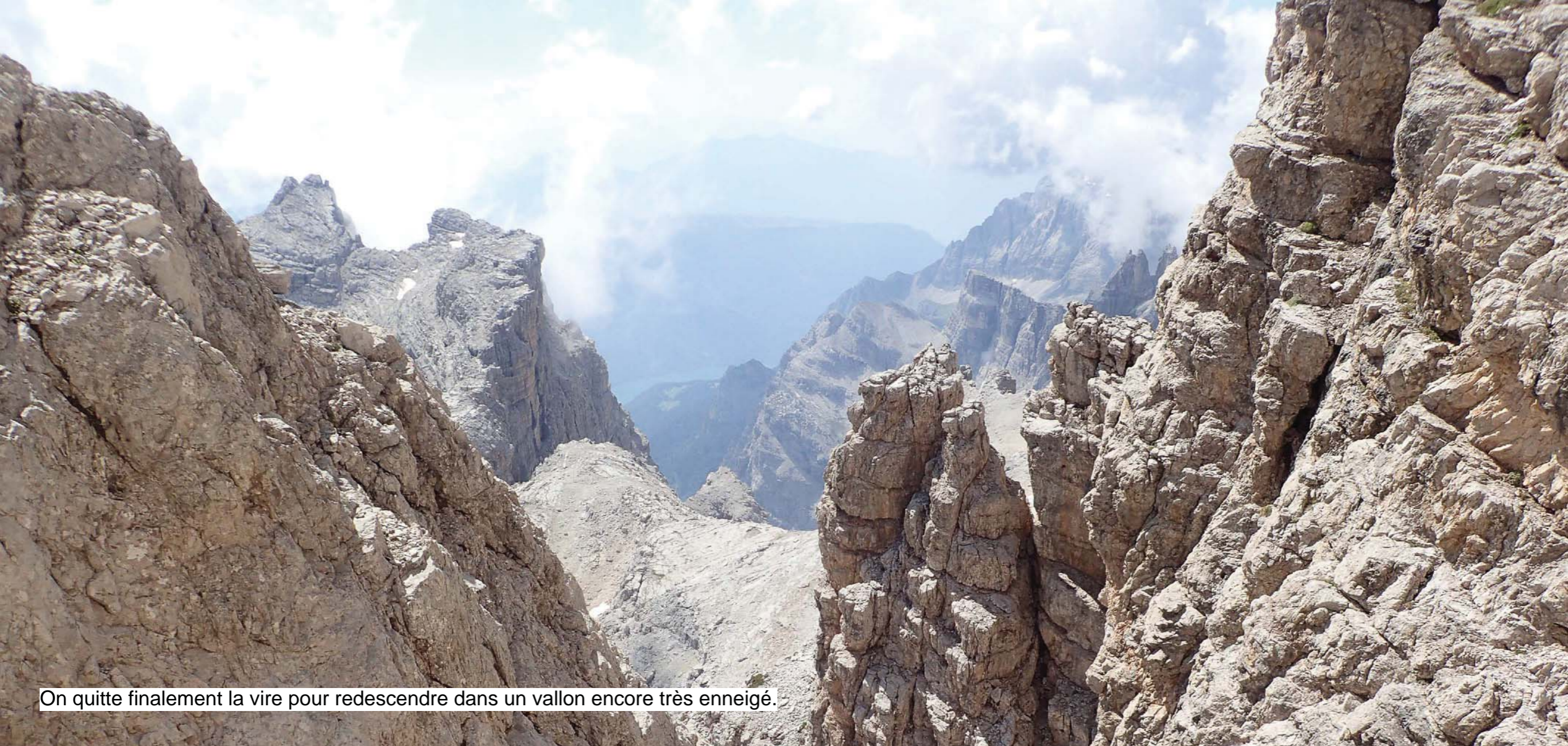
On quitte finalement la vire pour redescendre dans un vallon encore très enneigé.