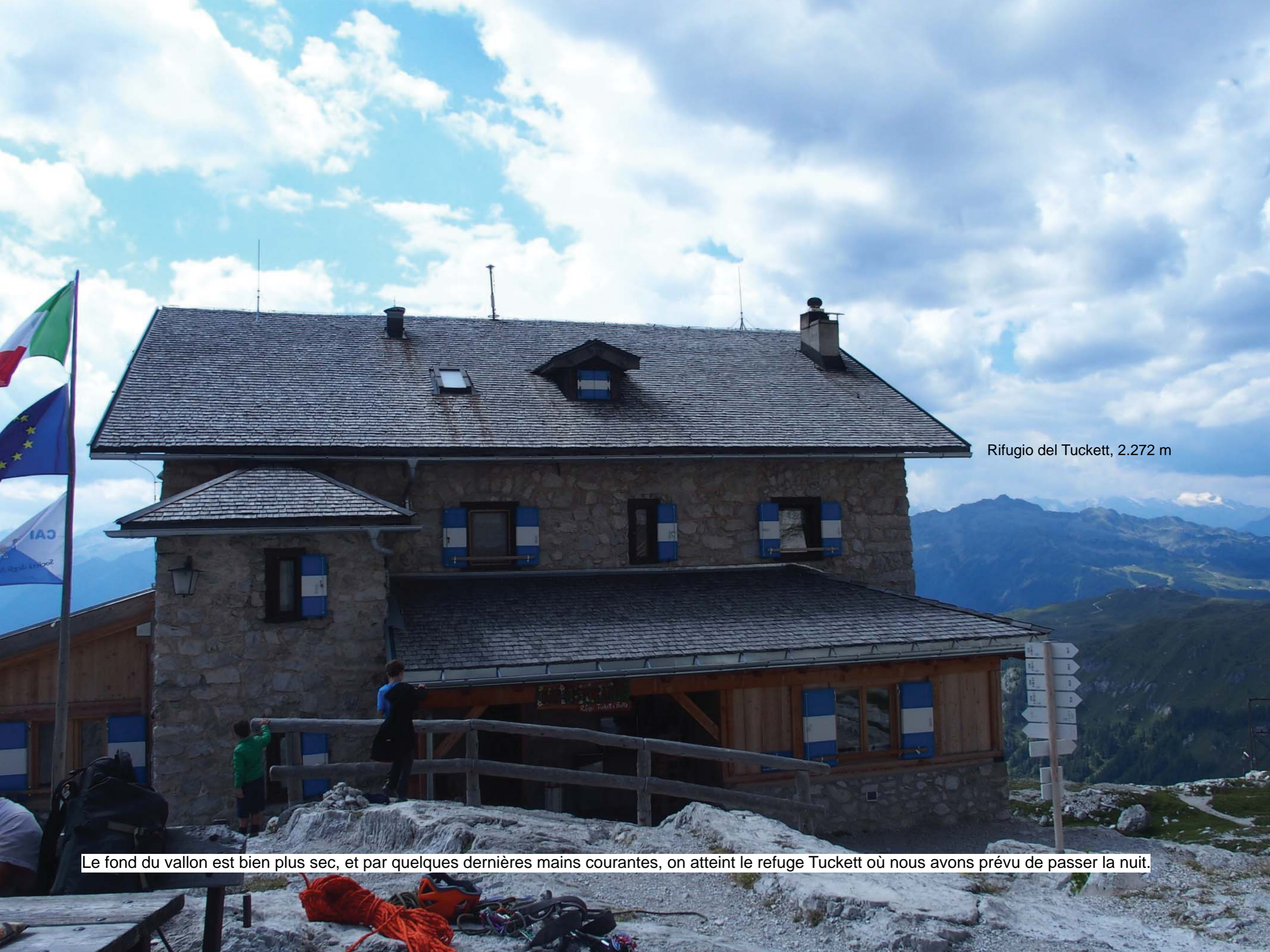
Rifugio del Tuckett, 2.272 m

Le fond du vallon est bien plus sec, et par quelques dernières mains courantes, on atteint le refuge Tuckett où nous avons prévu de passer la nuit.